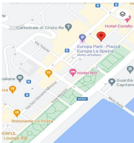
PIAZZA EUROPA LA SPEZIA